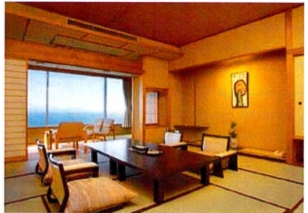
※客室（和室）全室から駿河湾を一望