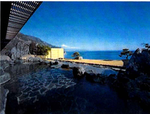
※海拔 90m の絶壁にある露天風呂。 遠く 富士山と伊豆連山を望む。