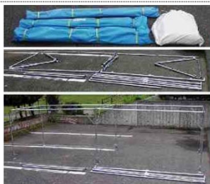
①フレームを差し込んで組立