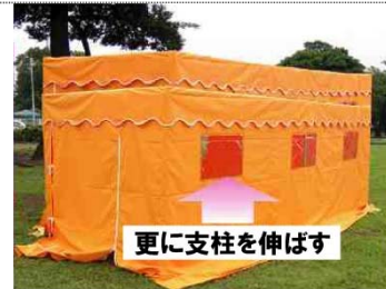
③四方幕をセット、更に支柱を伸ばす