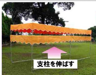
②天幕をセット、支柱を伸ばす