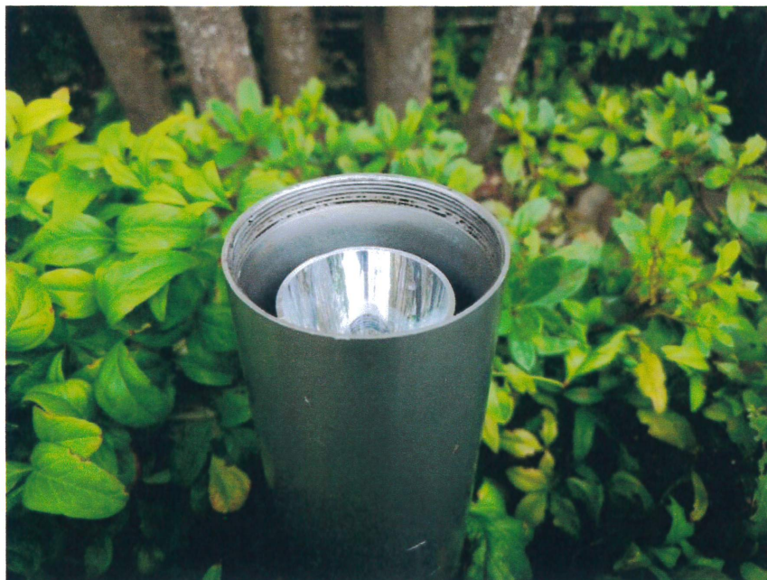
ガラスカバー取外し