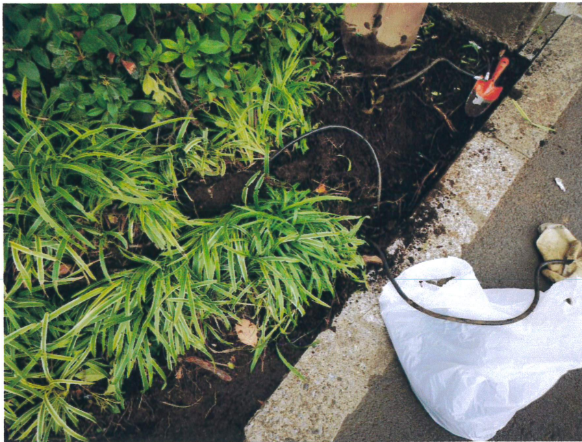
照明器具側電線 破損 断線調査