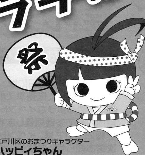
江戸川区のおまつりキャラクター ハッピーちゃん