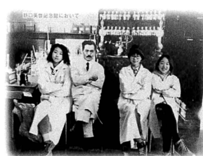
野口英世記念館にて