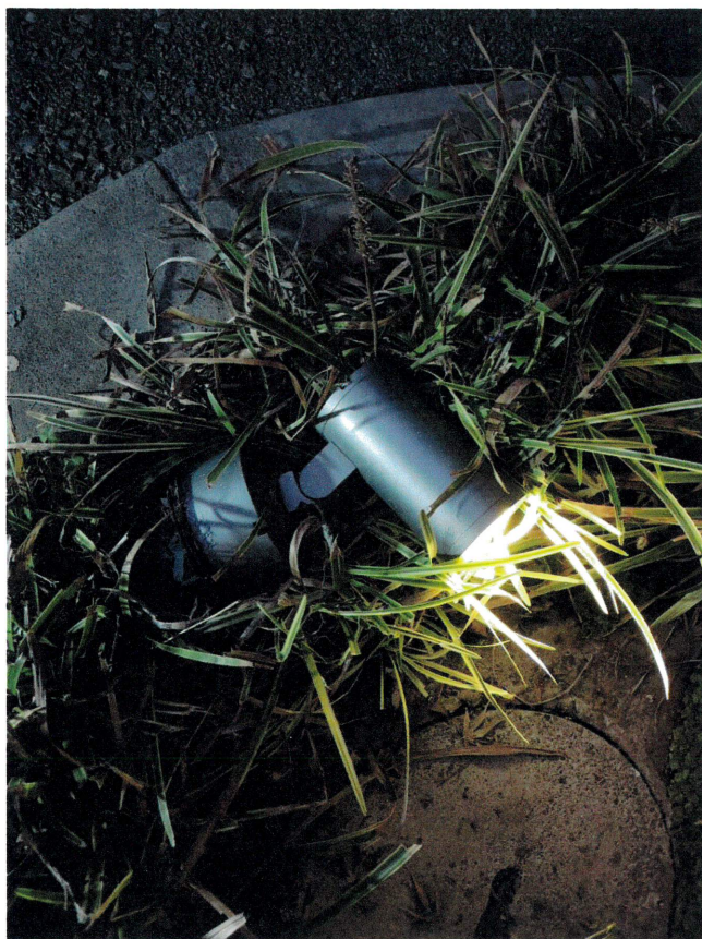
調査、点検アッパーライト