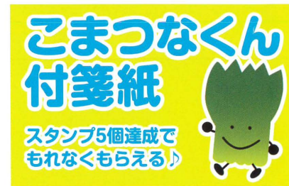
こまつなくん付箋紙

スタンプを集めて抽選でステキな賞品が当たる! ※写真は賞品イメージです。実際の品と異なる場合がございますので、ご了承ください。