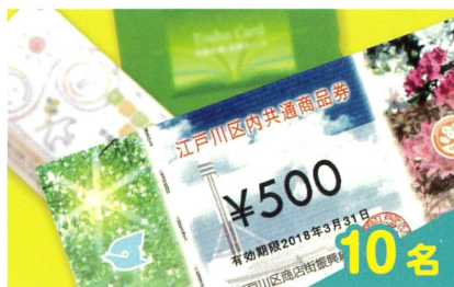
区内共通商品券 3,000 円分