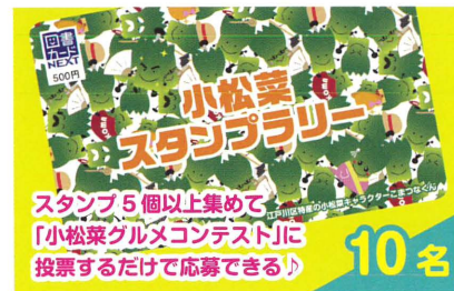
こまつなくん図書カード 3,000 円分