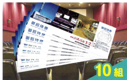
船堀シネバル映画ペアチケット