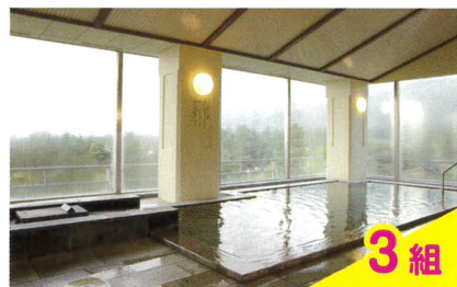
穂高荘ペア宿泊券