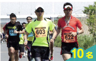
小松菜マラソン出走券