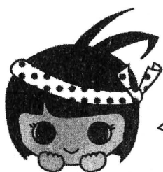
江戸川区 おまつりキャラクター ハッピーちゃん