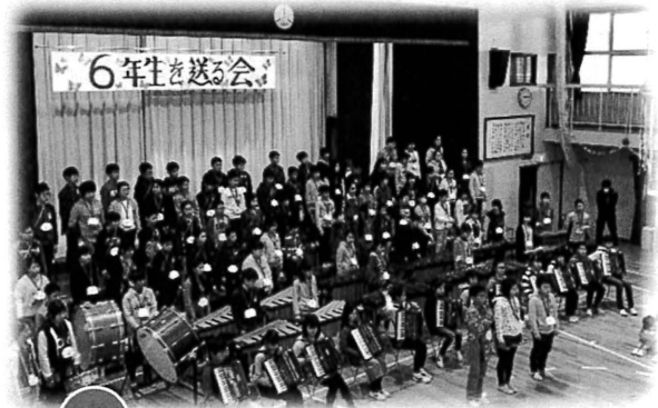
6年生 合奏[ひまわりの約束]