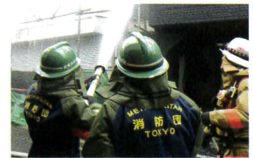
放水による消火や避難誘導