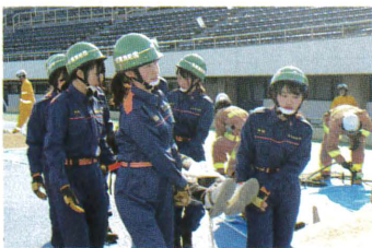
災害から住民を守るための教育訓練