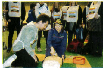
住民の防災行動力を高めるための初期消火や応急救護などの指導