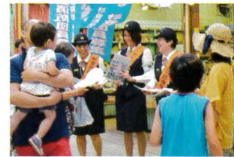
防災週間や地域の催し物が行われるときの火災予防などの広報