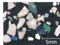
太平洋で採取された マイクロプラスチック

海ごみの大半はプラスチックです。プラスチックが紫外線や波の力によって5mm以下に細かく砕かれたかから「マイクロプラスチック」です。日本近海だけでなく、世界中の海でマイクロプラスチック汚染は深刻な状況です。化学物質を吸着したマイクロプラスチックを海の生きものが食べてしまい、 食物連鎖によって化学物質が濃縮され、それを食べた人間の体に蓄積することが懸念されています。