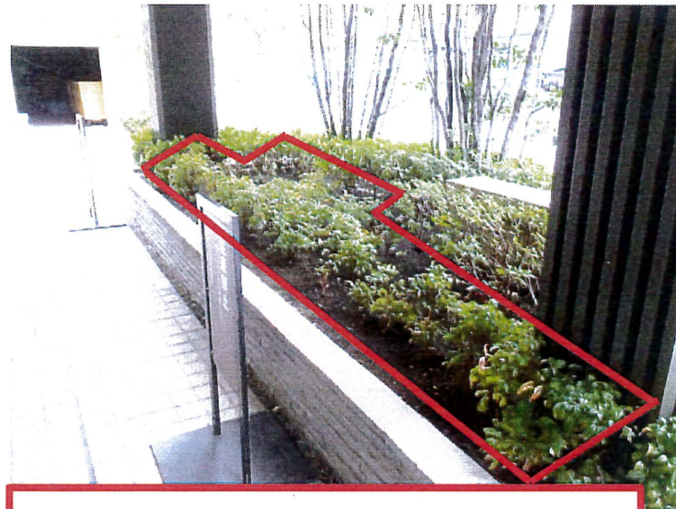
赤枠内フィリアオキ17株植栽