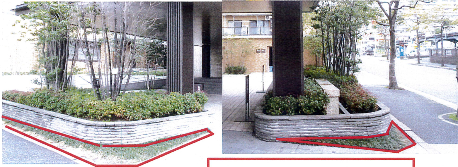
赤枠内コグマザサ52株植栽