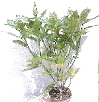
フィリアオキ 苗木