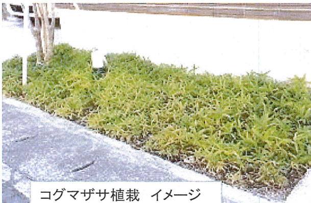
コグマザサ植栽 イメージ