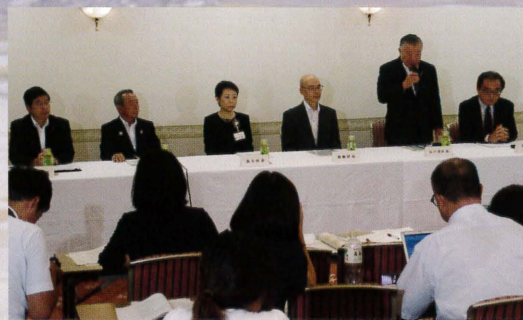
第2回江東5区大規模水害対策協議会