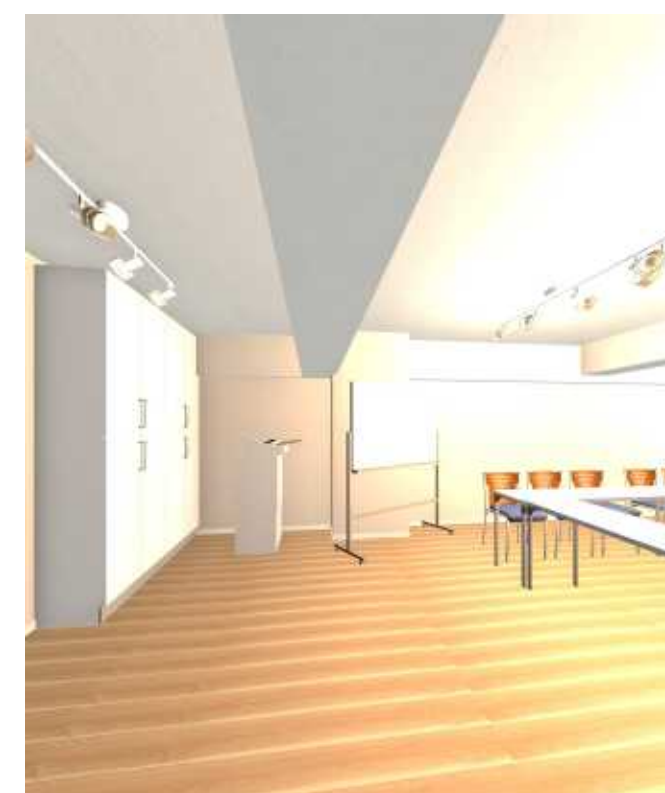
コピー回リイメー ジ