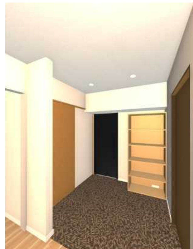
出入りロイメー ジ