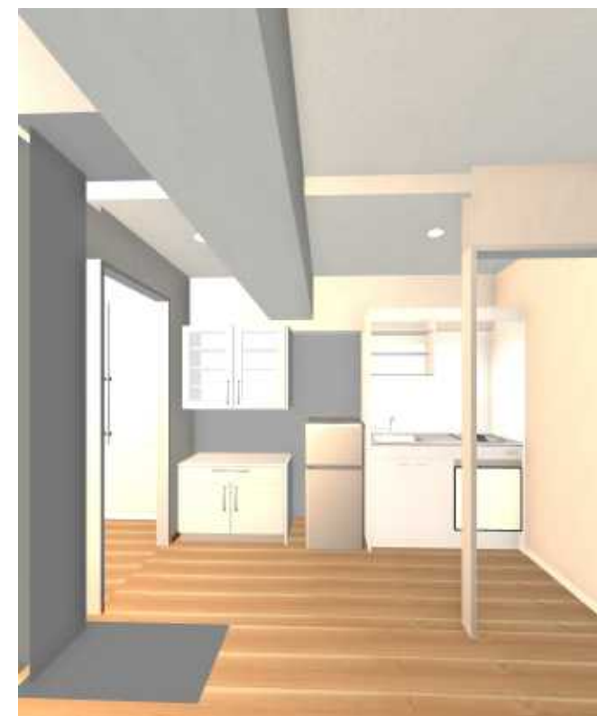
キッチンイメー ジ