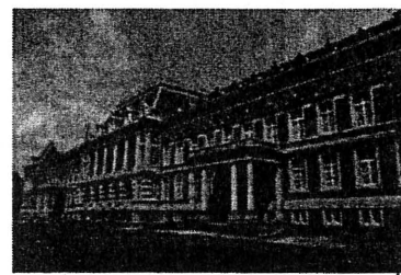
法務省旧本館前にて 記念撮影(好天の場合)