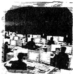
通 信 指 令 センター見学