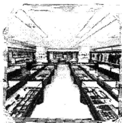
展 示 資 料 室 見 学