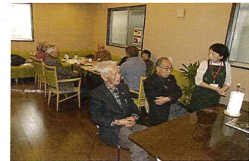
居場所・通いの場のイメージ