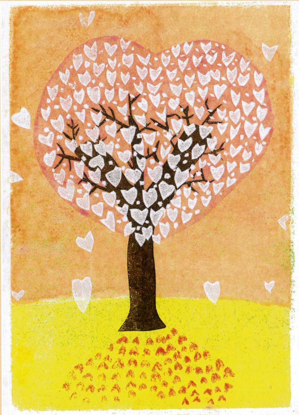
「Heartの樹」上田久世 Artbility ※この作品は障害者アーティストによる作品です