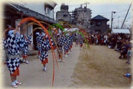
新川さくら館前の催し物

平成26年、桜の花が見頃を迎える時期に、新川千本桜の拠点である新川さくら館とその前の桜橋を会場に新川千本桜の会の主催により江戸の風情の中で桜を楽しむイベントとして「新川さくらまつり」が開催されました。