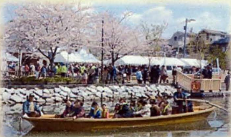
新川さくらまつりでの和船の運行

新川さくらまつりや新川の清掃活動を行っている新川げんき会が新川さくら館前で毎月行っている朝市に合わせて江戸川遊漁船組合やNPO法人和船の会が協力し、航行されています。