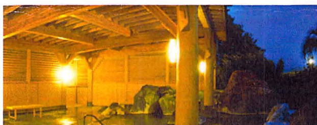
※露天風呂「龍神の湯」