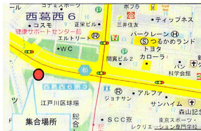
③江戸川球場（午後0時50分発）