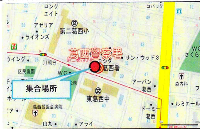
①葛西警察署前（午後0時50分発）