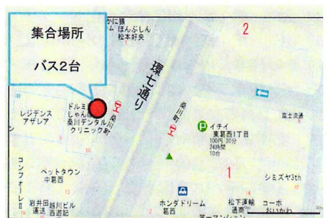
④桑川町バス停留所前（午後1時10分発）