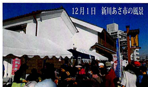
12月1日 新川あさ市の風景