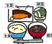
栄養バランスのとれた食生活を