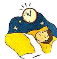
十分な睡眠をとる