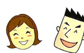
思い切り笑って免疫細胞を活性化