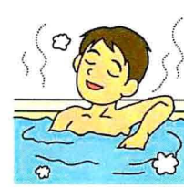
入浴で体をしっかり温める