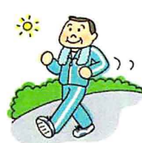
適度な運動をする

免疫力をアップするためにこんな生活をこころがけましょう ※他の生活習慣病の予防にもなります。