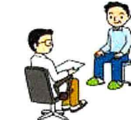
がん検診を受ける